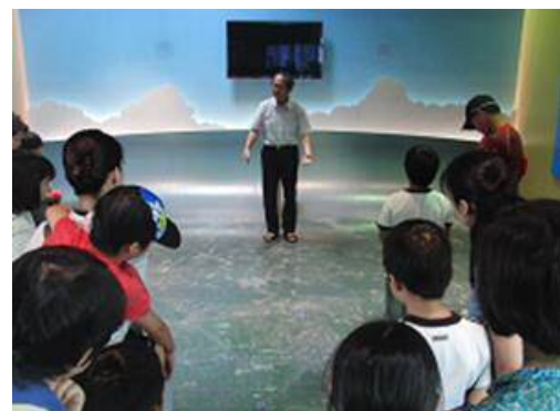
・さが水ものがたり館での説明