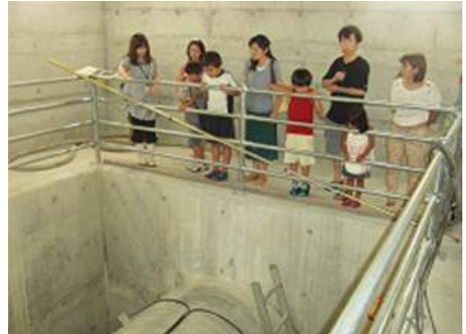
• 全てがビックサイズです