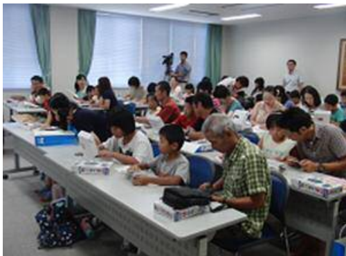
・ラジオに興味深々？