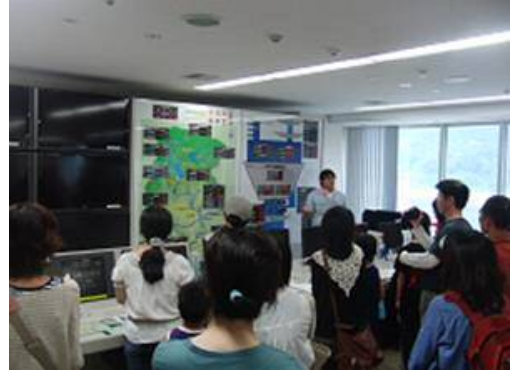
• 嘉瀬川ダム制御室