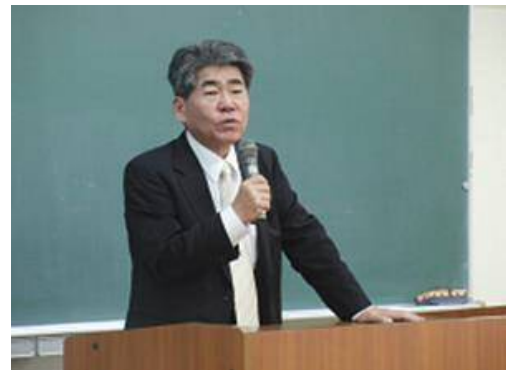
・岸本会長のあいさつ