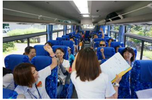
• 移動中も盛り上がってます