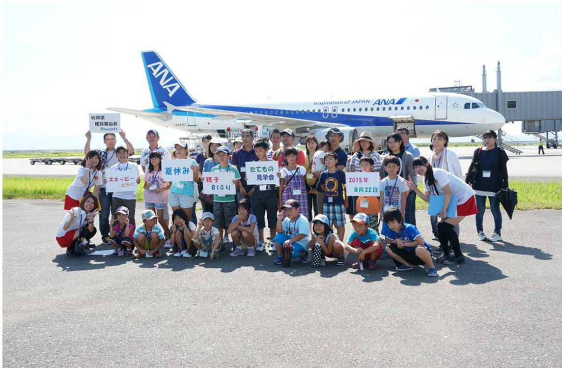
• 皆さん、お疲れ様でした！