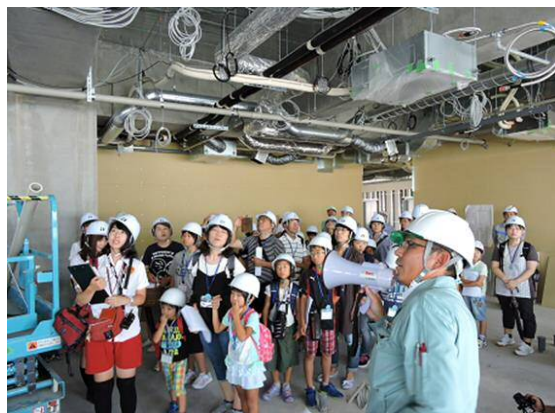
• 天井が無い時を見るのは初めて