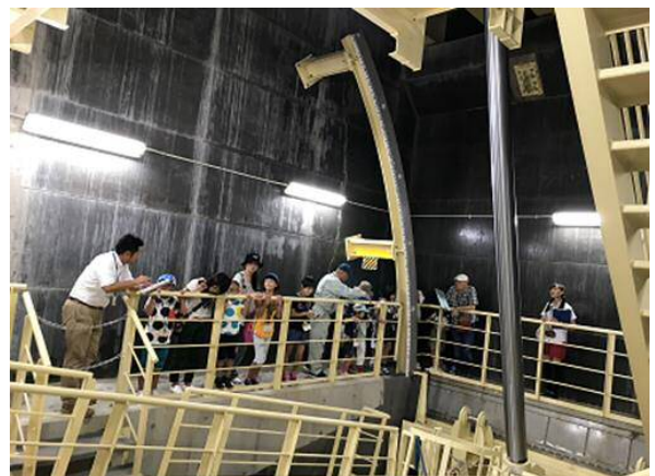
• 吐出工（水を吐き出す所）デカイ！