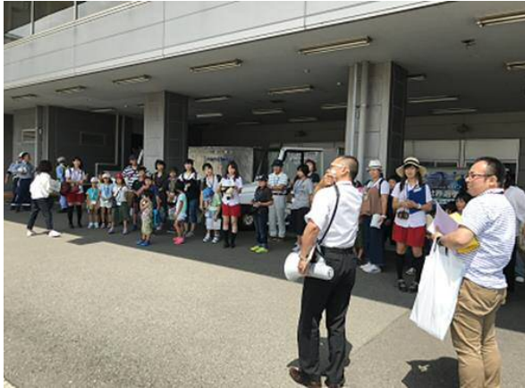
• 出発ゲートの真下です