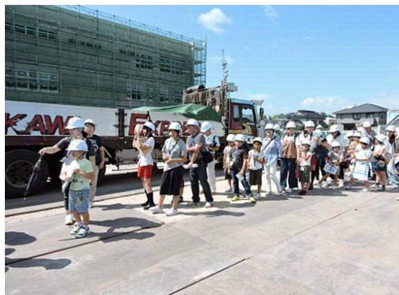
• 建設現場へレッツゴー！

当日ご参加頂いた皆様、そしてNBCラジオ佐賀・SKIPPYの皆さんに感謝いたします。