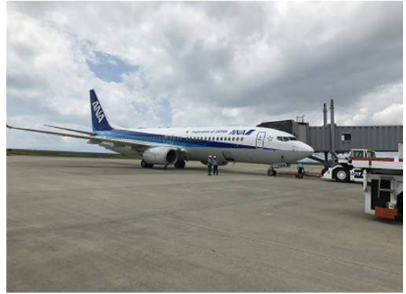
• かなり近いですよ