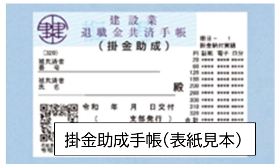
掛金助成手帳(表紙見本)